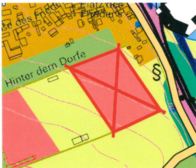
Ausschnitt FNP Großheringen - Wohnbaufläche „Am Angerborn“

Der folgende Teilbereich (zu entwickelnde Wohnbaufläche „Am Angerborn“) ist von der Genehmigung ausgenommen.